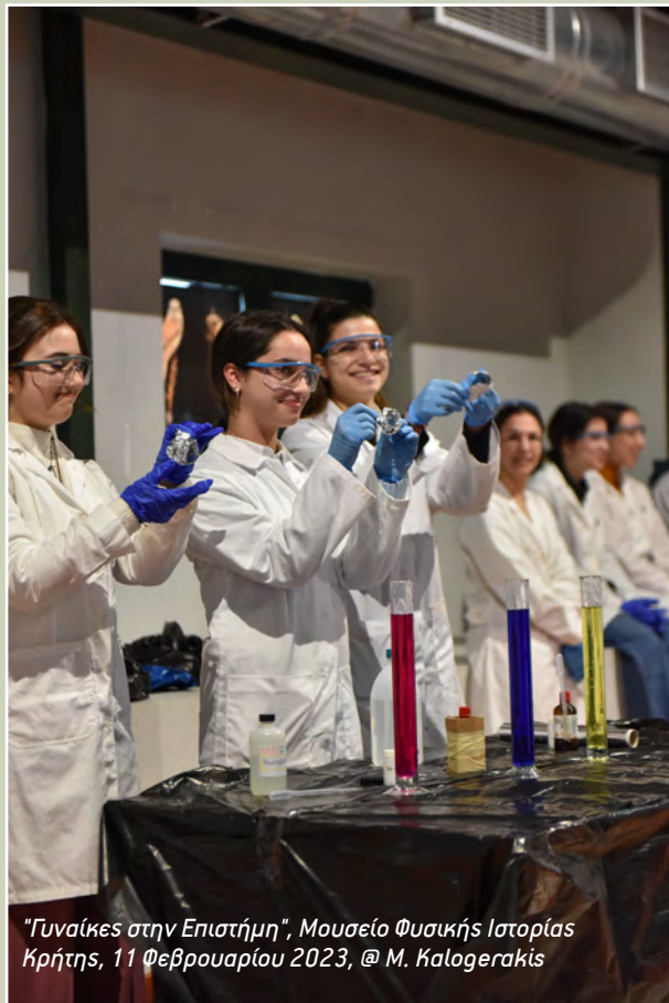
"Γυναίκες στην Επιστήμη", Μουσείο Φυσικής Ιστορίας Κρήτης, 11 Φεβρουαρίου 2023

από μέλος του ακαδημαϊκού προσωπικού. Στη συνέχεια οι μαθητές περιηγήθηκαν σε φοιτητικά και ερευνητικά εργαστήρια, όπου το διδακτικό προσωπικό και οι μεταπτυχιακοί φοιτητές τους παρουσίασαν πειράματα και εξοπλισμό τελευταίας τεχνολογίας. Αυτό που