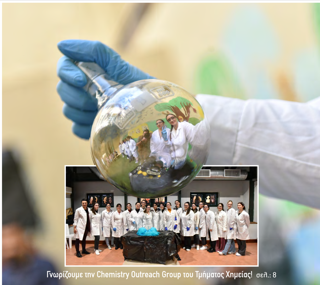
Γνωρίζουμε την Chemistry Outreach Group του Τμήματος Χημείας! σελ.: 8

Περιοδική Έκδοση του Πανεπιστημίου Κρήτης - Τεύχος 30 - Μάιος 2023 - www.uoc.gr/