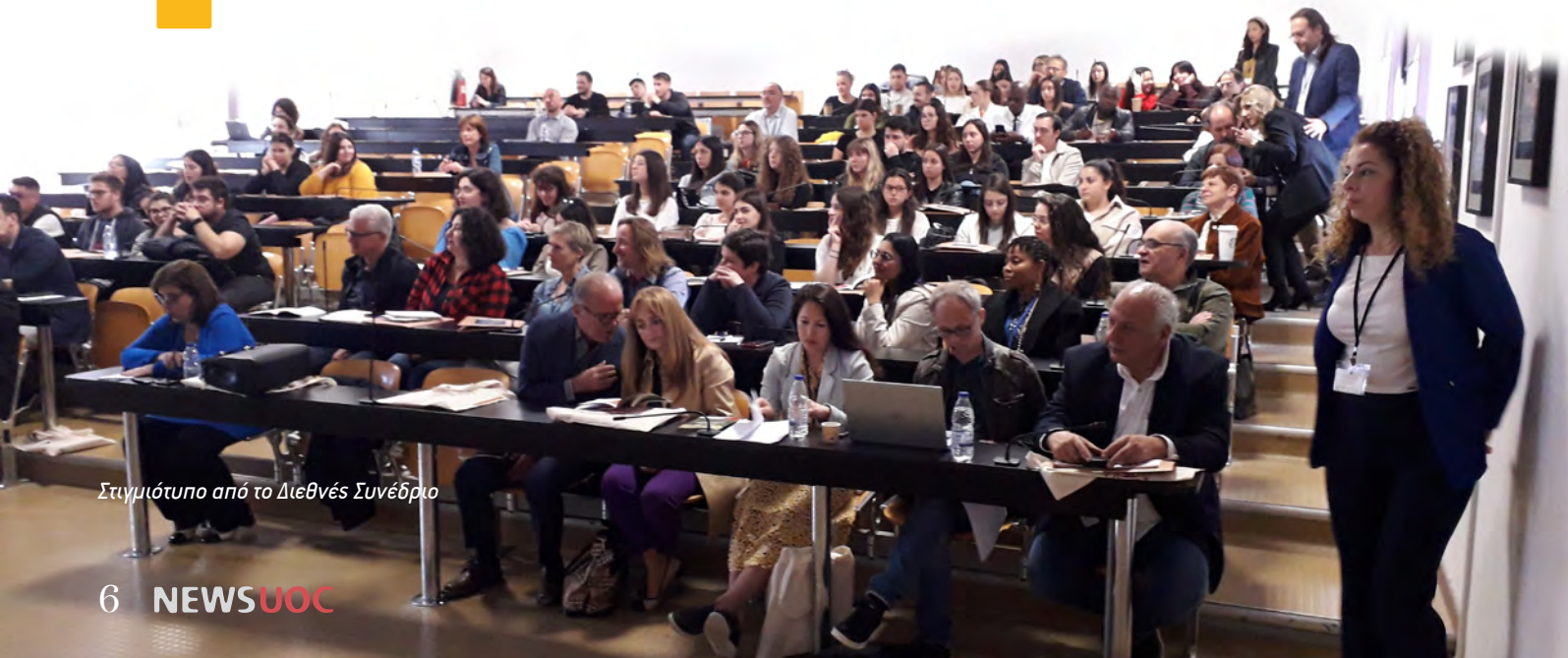
Στιγμιότυπο από το Διεθνές Συνέδριο